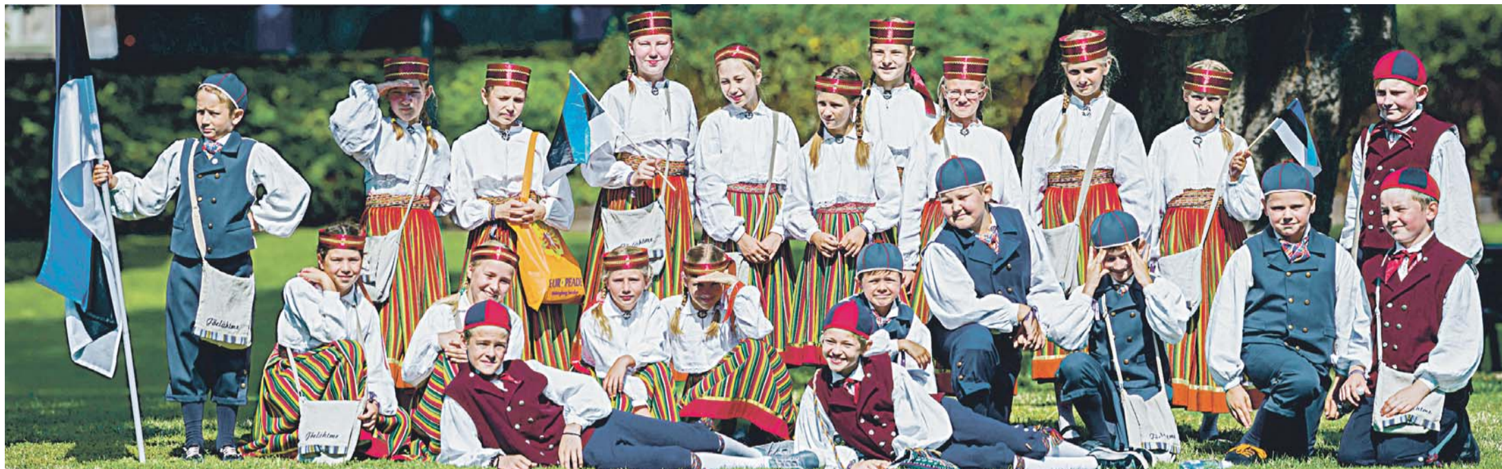
Kostivere ja Loo rahvatantsulaste rühm, kahepeale kokku 22 tantsijaga. Europeadel on palju kontserte ja esinemisi, mida vaadata ja kus ise osaleda. Meie usinatel lastel oli nelja päeva jooksul neli esinemist, seega saime iga päev olla rahvariites.