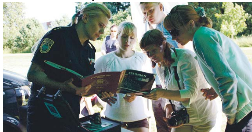
Piirivalvur tutvustas riigipiiril kasutatavat nägude tuvastamise aparati.

Kihelkonnapäeva jumalateenistusel oli oma kuuekümnepäevaste aasta tagust leiritõotust meenutamas kolm ja kahekümne viie aasta tagust kaks inimest. Pärast istusime paarikümnekesi ühise laua taga kiriklas.