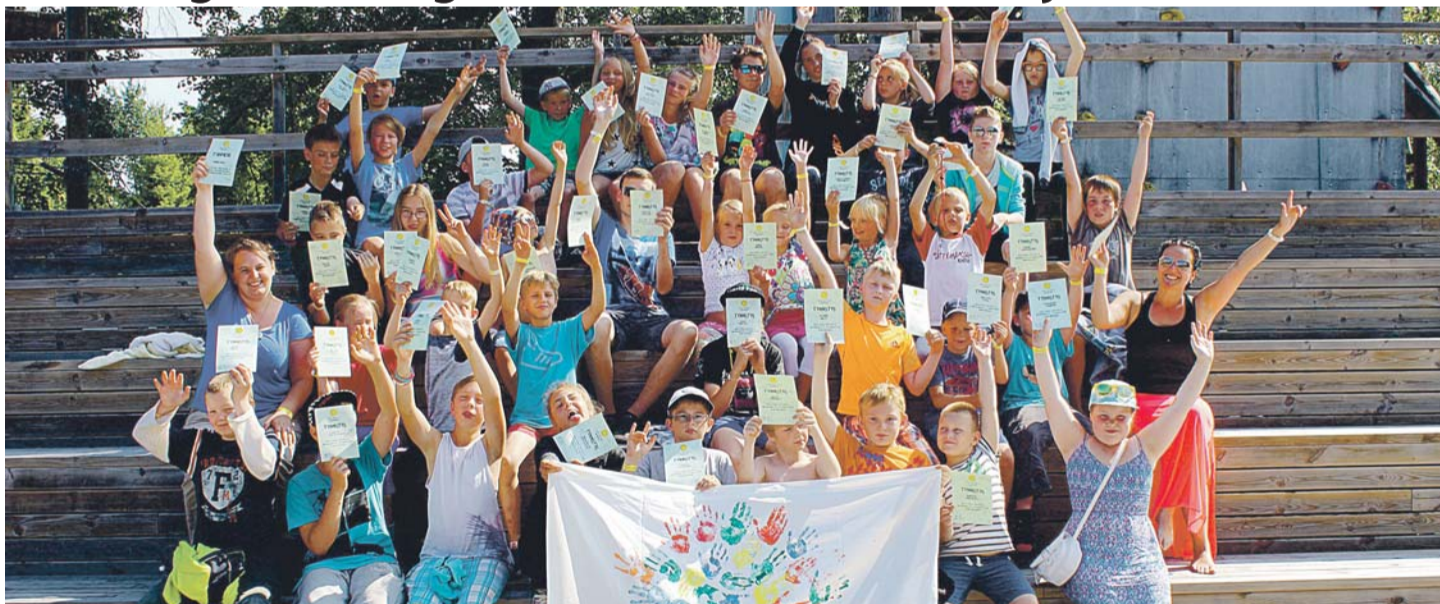
Laagris toimuvat oli võimalik jälgida blogi kaudu, blogi asub aadressil: srmlaager.blogspot.com.