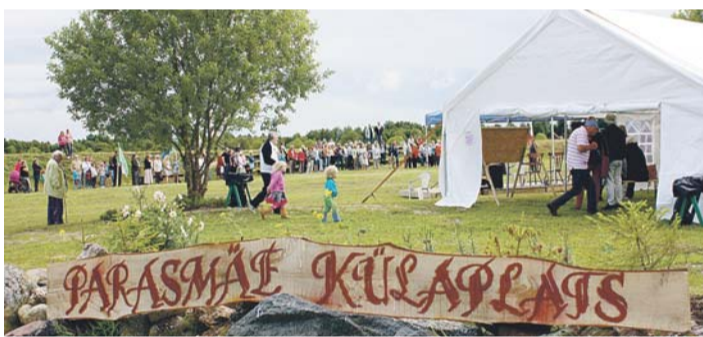
Põllult korjatud kividest tehtud aialt vaade külaplatsile.

tahtlikku töö korras valmistatud keraamilised auhinname-dalid.