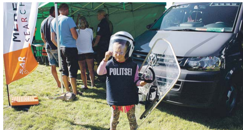
Lastel lubati käes hoida politsei kumminuia ja kilpi, selga sai proovida varustust.