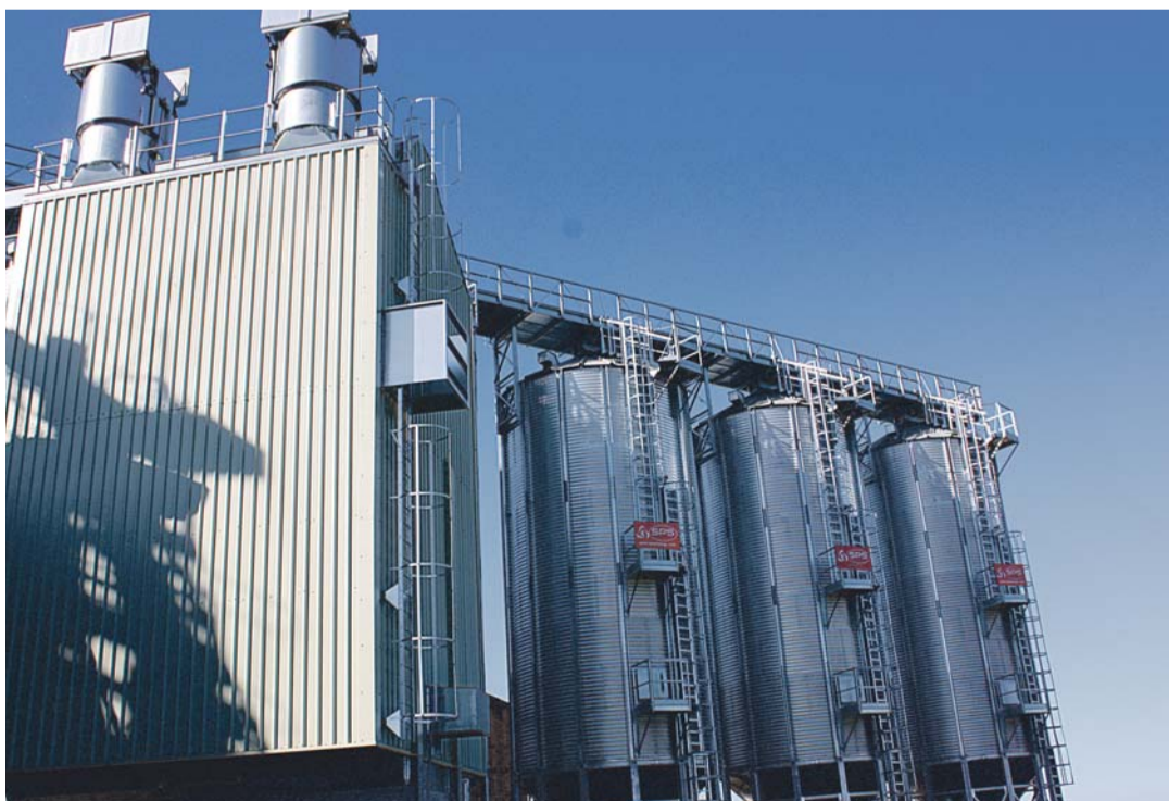
Kuivati töötab ööpäevaringselt, vilja kuivatamise teenust pakutakse laialt, vilja veetakse siia igalt poolt üle Eesti. Vili läheb läbi eelsäilituspunkrite kuivatisse ning siis elevaatoriga järelkuivatuse punkritesse. Väljuva viljamassi temperatuur peab olema 25 kraadi.